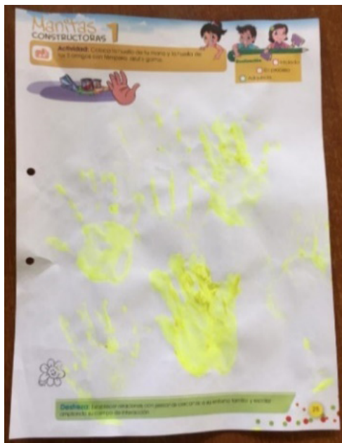
Ilustración 6» Modo de trabajo de centros.

En esta foto se refleja la imagen de niño que se proyecta en la escuela porque muchas de estas láminas son la huella de lo que han hecho durante su estancia en los centros educativos, láminas que generan frustración en los niños y niñas porque no quieren hacerlo, porque no lo disfrutaban, porque subestiman sus capacidades.