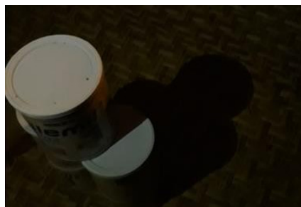
Ilustración 3 » Pensamiento complejo.

Es la construcción y sombra de Roberto nos comenta que hizo la sombra de una botella de perfume con los tarros de leche de su hermanito.