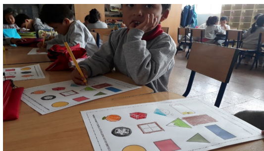
Ilustración 7» Expresiones repetitivas de los niños en centros.

No se les escucha, no importan sus intereses lo que importa es llenar una carpeta con muchas láminas de trabajo porque no importa el proceso sino el resultado, importa la motricidad fina que se refleje en pintar sin salirse de los bordes, así es la única manera de hacerlo o hay otras maneras. Para el ámbito de expresión y comprensión del lenguaje la única forma es utilizar los mismos cuentos y hacer que los niñas y niños repitan acaso dudamos de su capacidad para crear en lugar de reproducir.